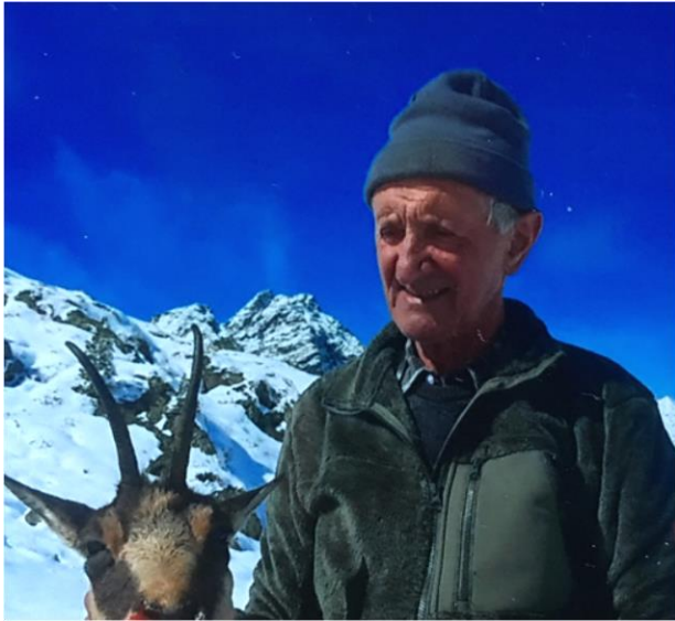
Weidmannsheil 2020 - Gamsgeiß 13 Jahre